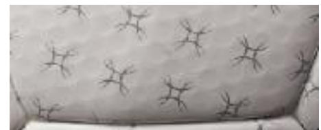
ボール表皮のディンプル加工

ボール表皮のディンプル（くぼみ）加工により、飛行中の空気抵抗を軽減し、ボール軌道のブレを抑制しました。これにより、コントロール性能がさらにアップし、より高精度のパスやシュートが可能になりました。