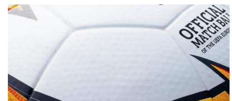
ボール表皮のディンプル加工

ボール表皮のディンプル（くぼみ）加工により、飛行中の空気抵抗を軽減し、ボール軌道のブレを抑制しました。これにより、コントロール性能がさらにアップし、より高精度のパスやシュートが可能になりました。(F5U5003-K19)